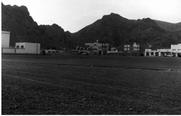
Uhud Dađı'ndan iki manzara